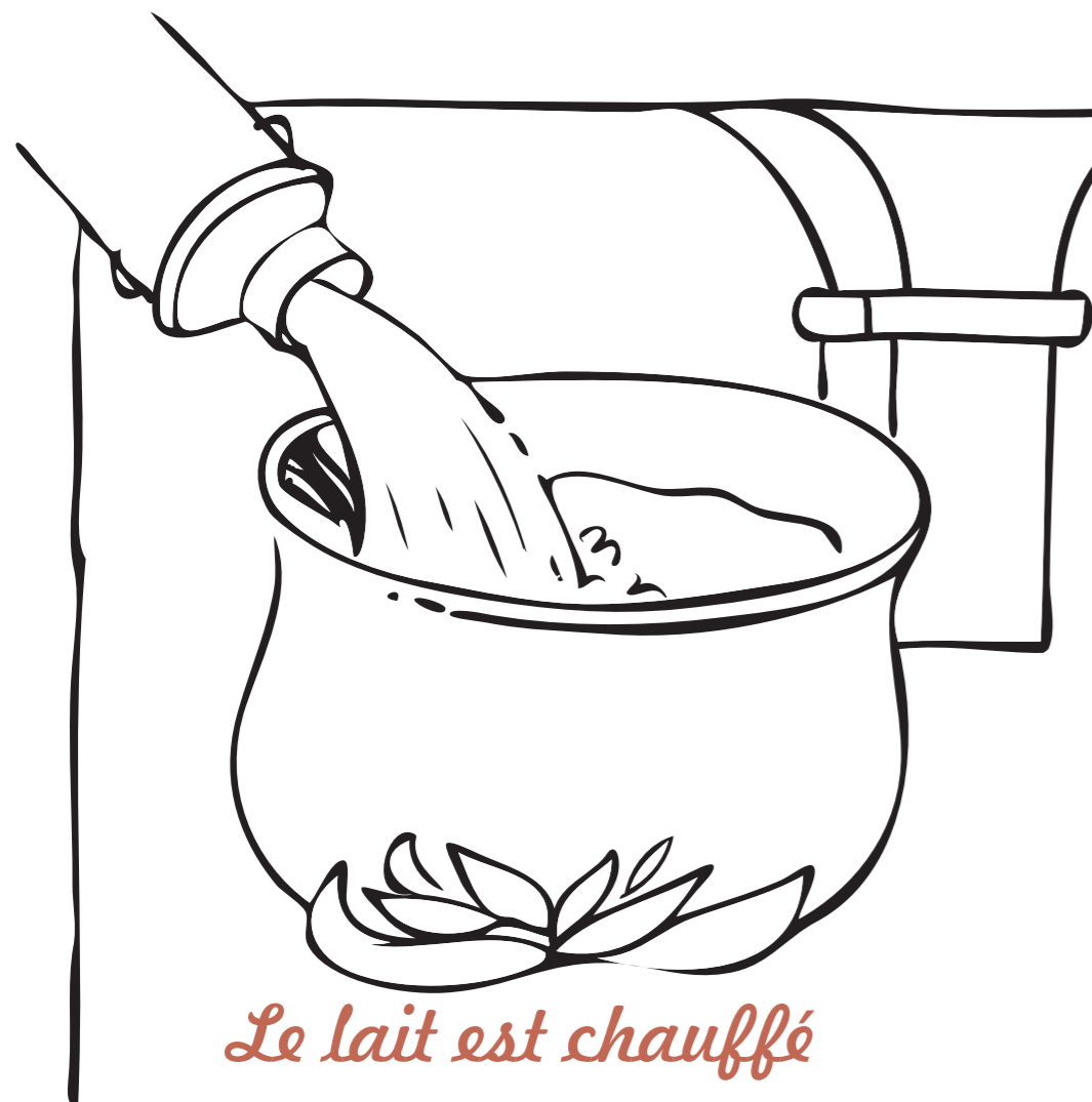
Le lait est chauffé