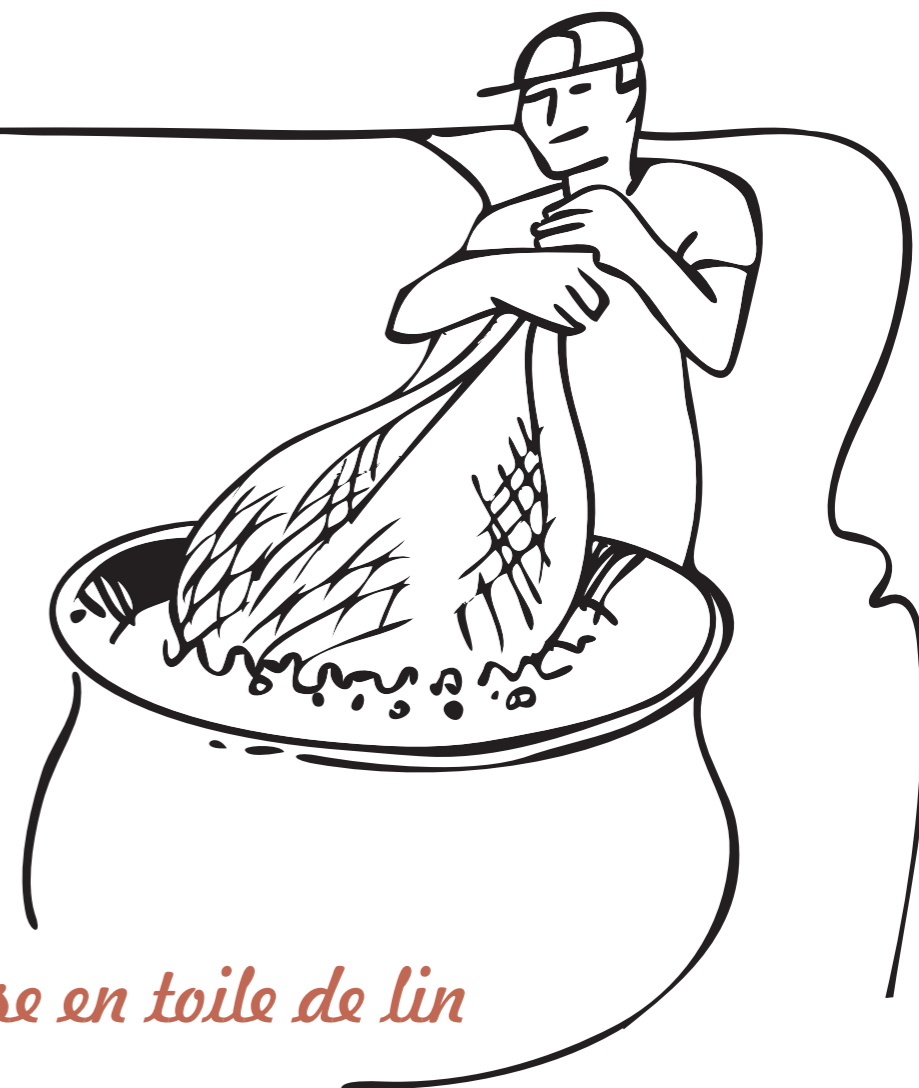
Mise en toile de lin