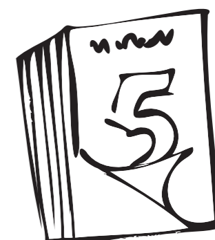
Affinage en cave fraîche (6 à 9 mois)