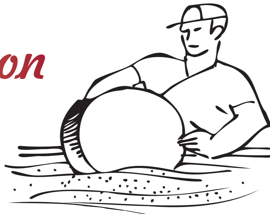
Bain de saumure